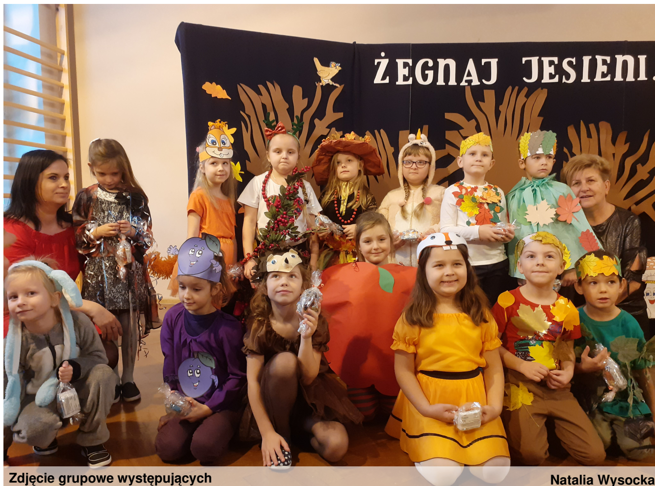
Zdjęcie grupowe występujących