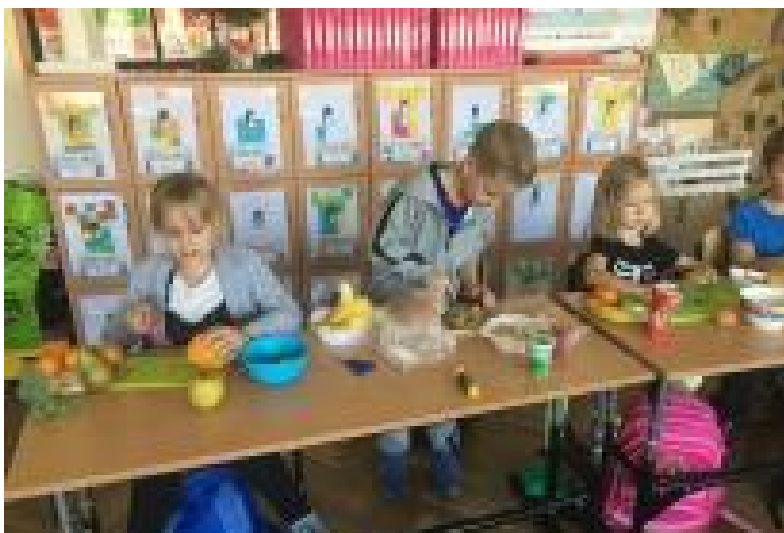
Sałatki owocowe klasy II

Co to znaczy zdrowo się odżywiać? Uczniowie klasy drugiej wiedzą to doskonale. Teoretyczne wiadomości poparte praktyką, zapadają w pamięć. Czytaj strona 2