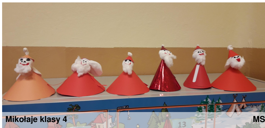
Mikołaje klasy 4

Gdy nadchodzi grudzień, wszyscy z niecierpliwością czekają na pewnego pana w czerwonym stroju, który przychodzi z wielkim workiem. Również uczniowie klasy IV chcąc zachęcić Mikołaja do szybszego przybycia, przygotowali małe Mikołajki. Na lekcję techniki przynieśli czerwone kartki, ręczniki kuchenne, płatki kosmetyczne oraz watę i z pomocą nauczycielki zabrali się do pracy.