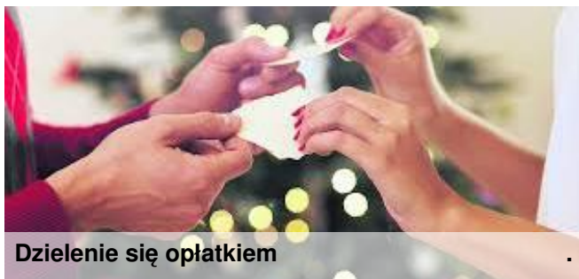
Dzielenie się opłatkiem