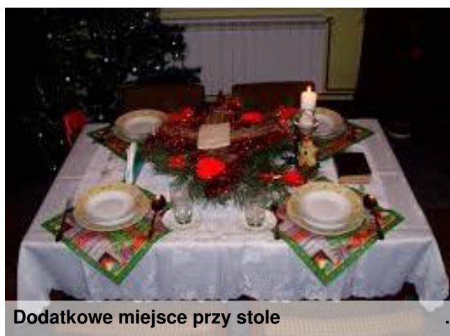
Dodatkowe miejsce przy stole