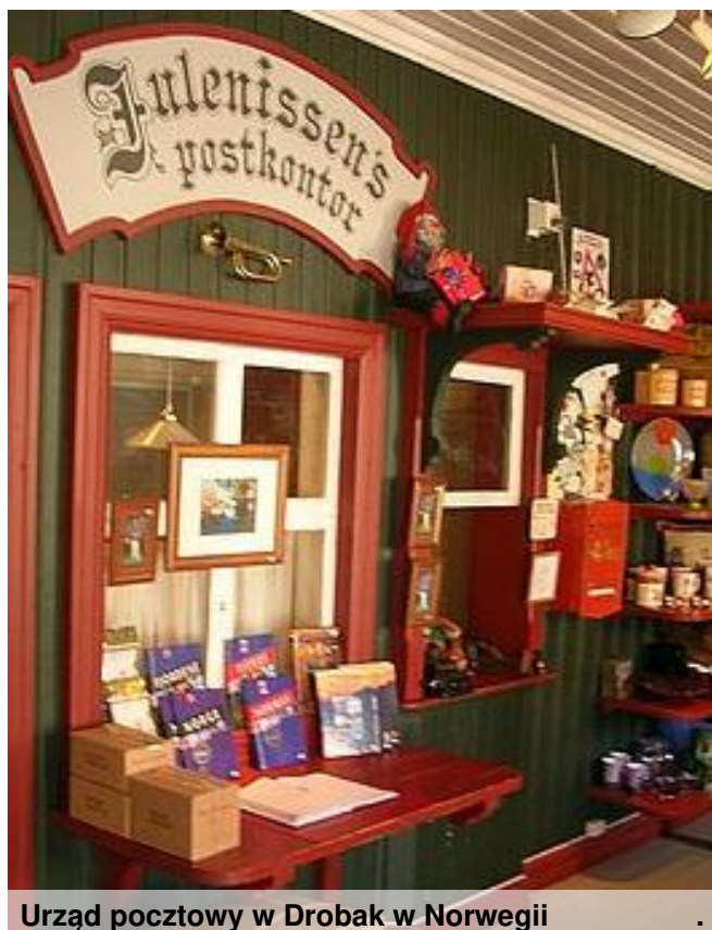
Urząd pocztowy w Drobak w Norwegii