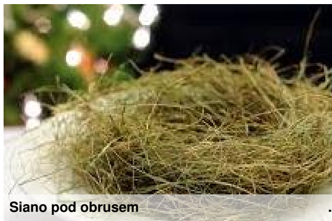
Siano pod obrusem

Wolne nakrycie przy stole to ważna tradycja wigilijna, która każe nam pamiętać o wszystkich samotnych osobach. Oznacza to także, że jesteśmy gotowi zaprosić do stołu każdego, kto w ten wieczór zapuka do naszych drzwi. Puste nakrycie daje również wyraz pamięci o bliskich, którzy nie mogli z nami spędzić świąt lub na zawsze odeszli.