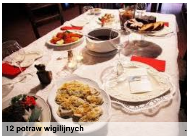
12 potraw wigilijnych