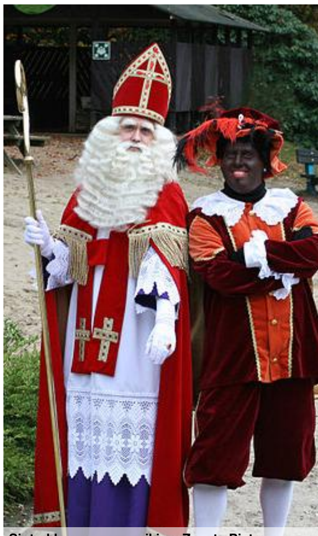
Sinterklaas z pomocnikiem Zwarte Piet