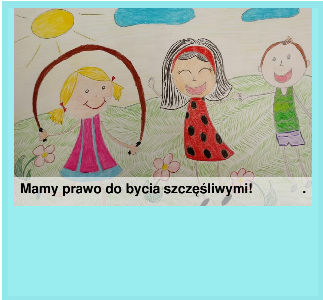
Mamy prawo do bycia szczęśliwymi!

W listopadzie i grudniu uczestniczyliśmy w szkolnym konkursie "Prawa dziecka". Oto niektóre z naszych prac.