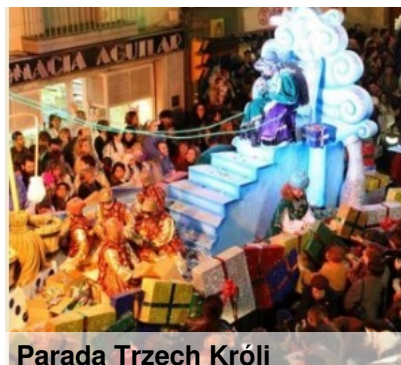
Parada Trzech Króli

Dzieci w Hiszpanii są w tym okresie bardzo rozpieszczane. Dostają prezenty nie tylko 25 grudnia, ale też 6 stycznia. Trzej królowie zostawiają dzieciom upominki. Bardzo hucznie obchodzi się tu święto Trzech Króli. W większych miastach, nocą odbywają się uroczyste pochody. Po parady królowie witają się z dziećmi. Odwiedzają też dzieci w szpitalach. Zwłaszcza dla nich jest to niesamowite przeżycie.