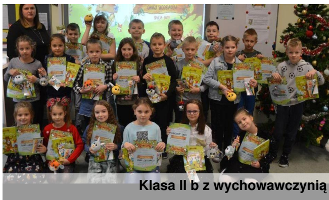
Klasa II b z wychowawczynią