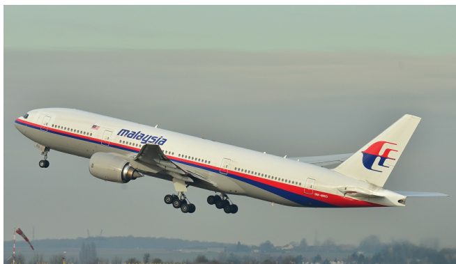
Boeing 777-200ER od Malaysia Airlines podczas startu.

Malezyjski minister transportu Hishammuddin Hussein początkowo ogłosił, że sprawdzana jest tożsamość czterech pasażerów, ostatecznie potwierdzono jednak, że tylko dwóch pasażerów posługiwało się skradzionymi paszportami , austriackim i włoskim. Jak ustalono, pasażerowie ci byli obywatelami Iranu, którzy podróżowali do Europy, w celu ubiegania się tam o azyl.