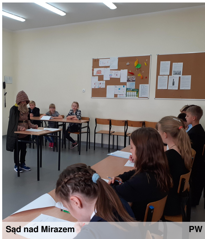
Sąd nad Mirazem