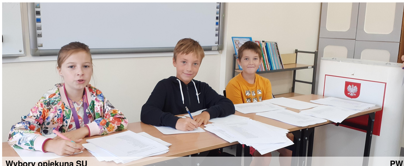
Wybory opiekuna SU