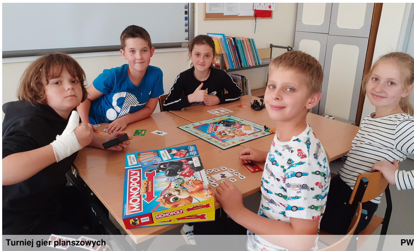
Turniej gier planszowych