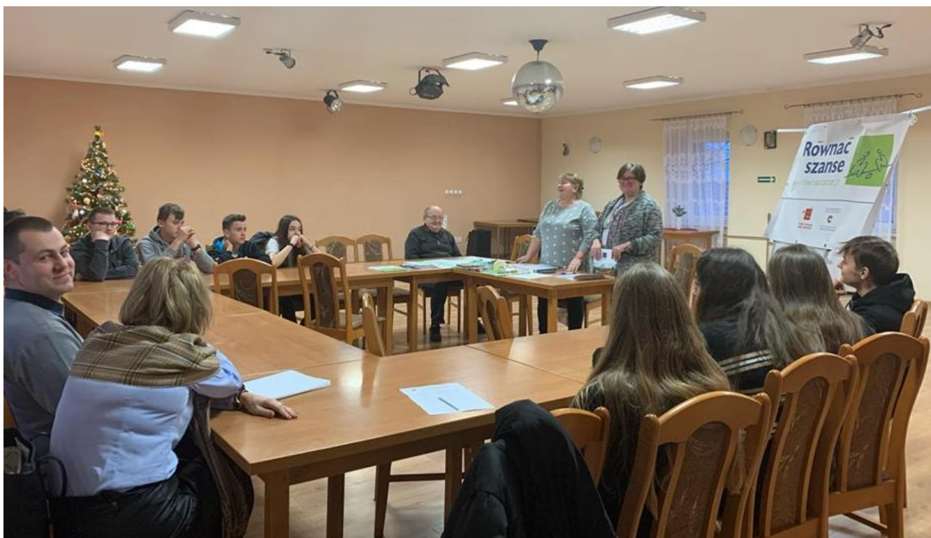
Family values PUTW