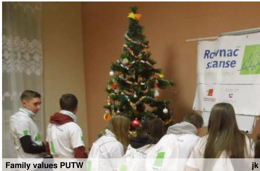
Family values PUTW