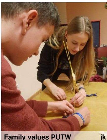
Family values PUTW