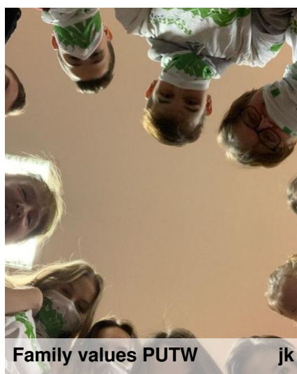
Family values PUTW

"Musisz wiedzieć, że każda Twoja decyzja w życiu jest determinowana przez hierarchię wartości. Każdy cel, jaki sobie stawiasz, gdy jest spójny z Twoimi wartościami, będzie prawdziwie Twoim celem i z pewnością będzie generować wiele motywacji. Pozwoli Ci podążać we właściwym kierunku. Każda decyzja sprawi, że będziesz czuł się szczęśliwy".