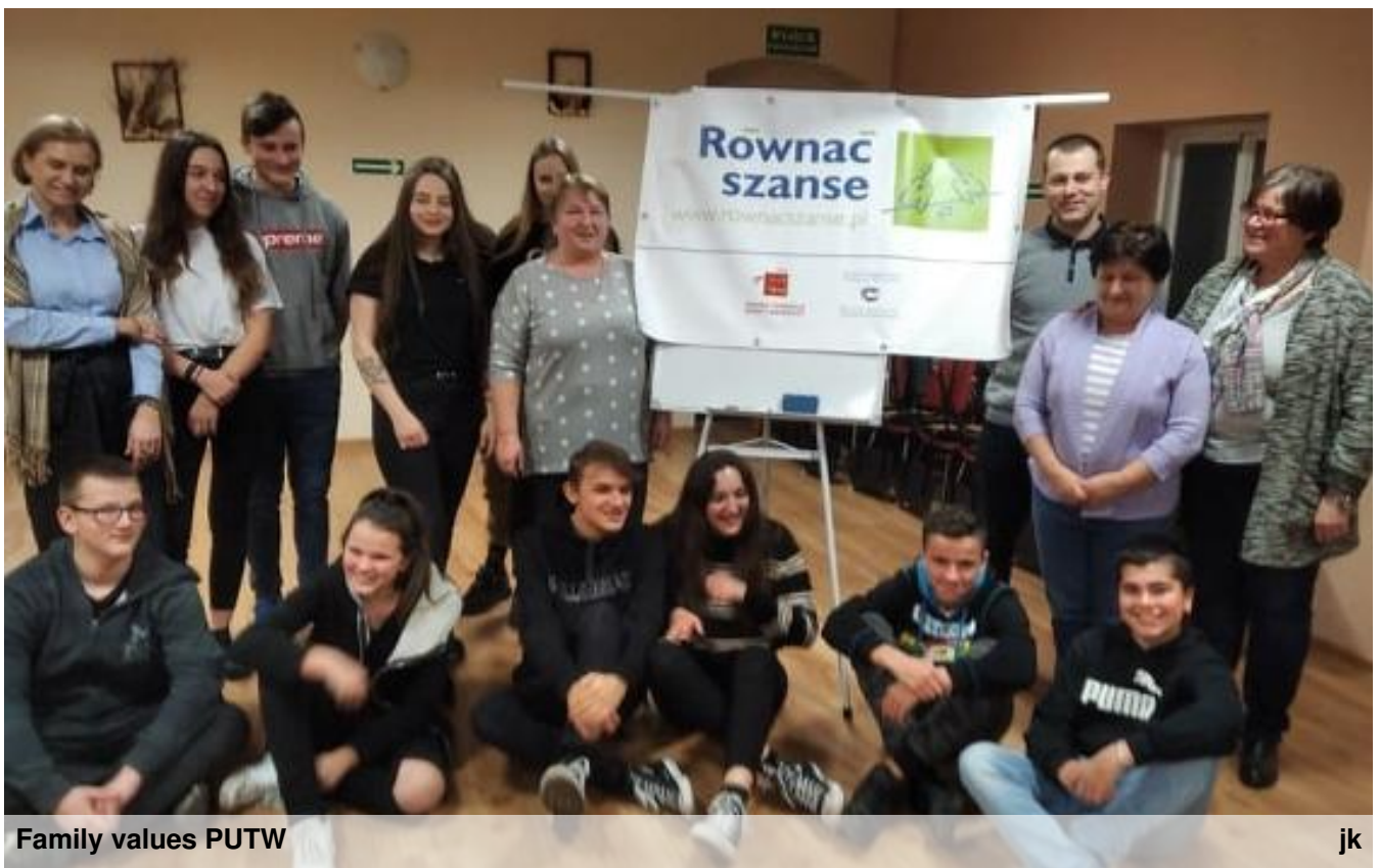
Family values PUTW