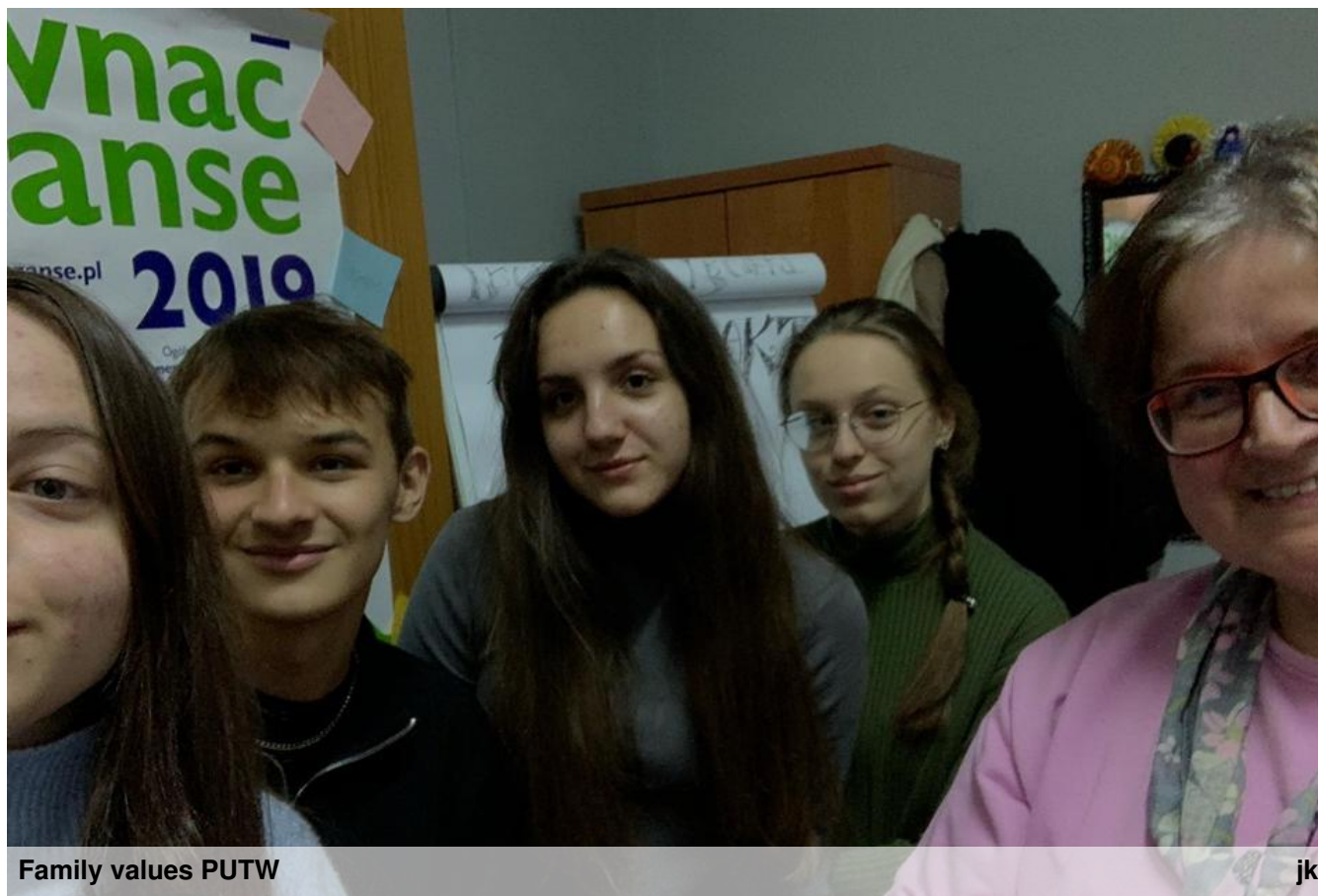
Family values PUTW