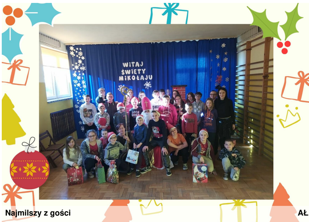
Najmilszy z gości