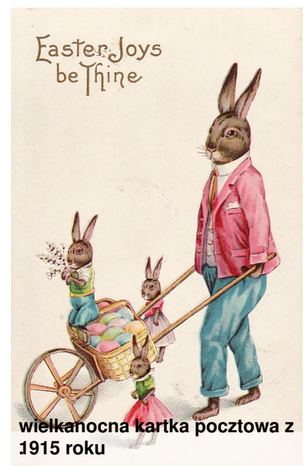
wielkanocna kartka pocztowa z 1915 roku