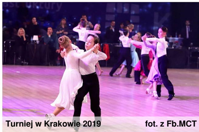
Turniej w Krakowie 2019

Nie wyobrażam sobie, że mógłbym nagle przestać ćwiczyć i nie jeździć na zawody. Bardzo brakowałoby mi tego.