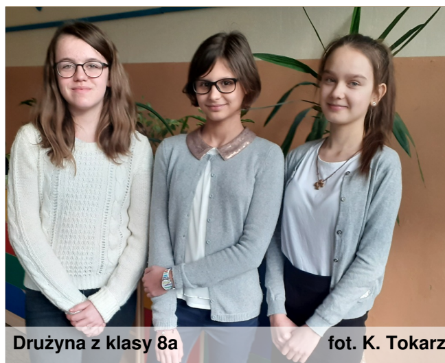
Drużyna z klasy 8a