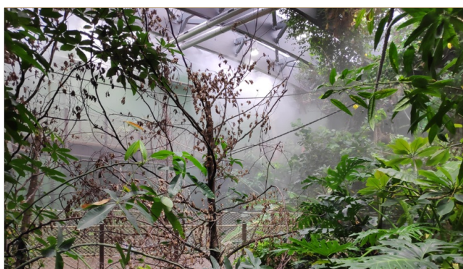
Aquatis Aquarium-Vivarium