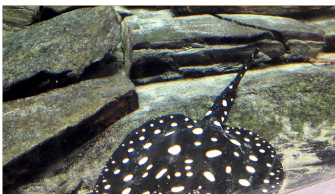
Aquatis Aquarium-Vivarium