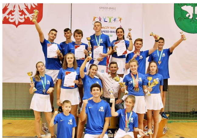
Drużyna z Krakowa

Gdyby nie oni, nie byłabym w tym miejscu, w którym jestem teraz. Najwięcej zawdzięczam tacie, bo to on finansuje wszystkie moje wyjazdy i najmocniej wspiera mój rozwój.