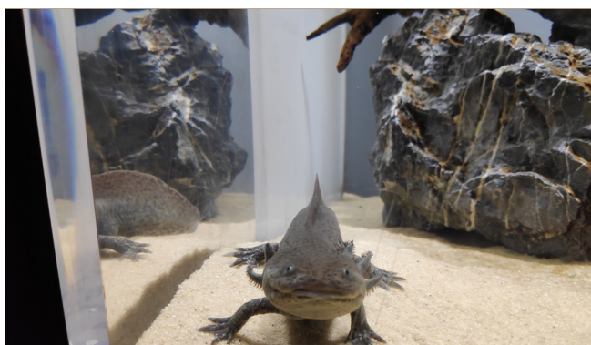
Aquatis Aquarium-Vivarium