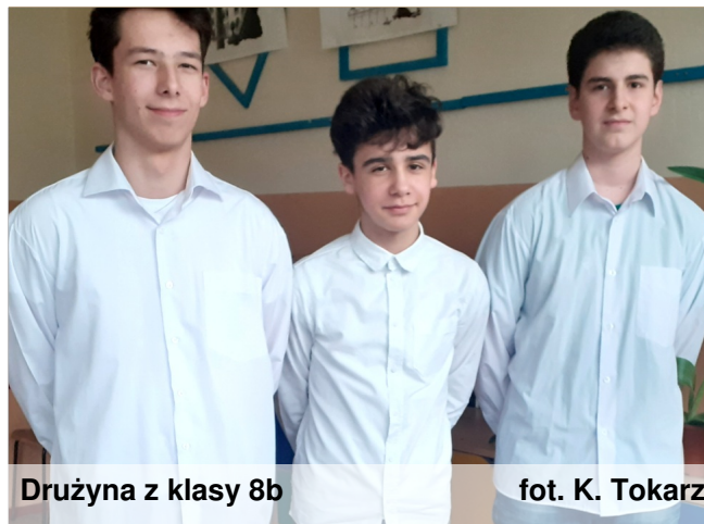
Drużyna z klasy 8b