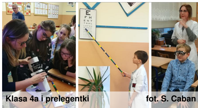
Klasa 4a i prelegentki