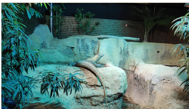
Aquatis Aquarium-Vivarium