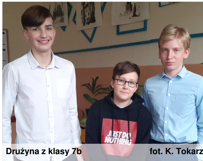
Drużyna z klasy 7b