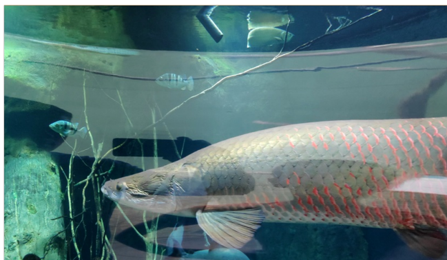
Aquatis Aquarium-Vivarium