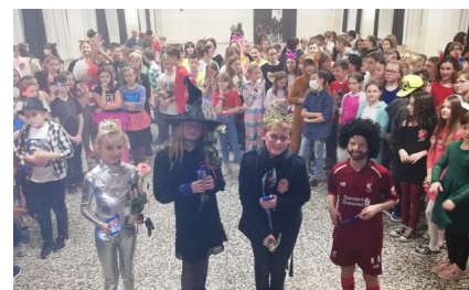
Królowe i królowie Balu Przebierańców w klasach IV-VI i klasach VII-VIII (niżej)