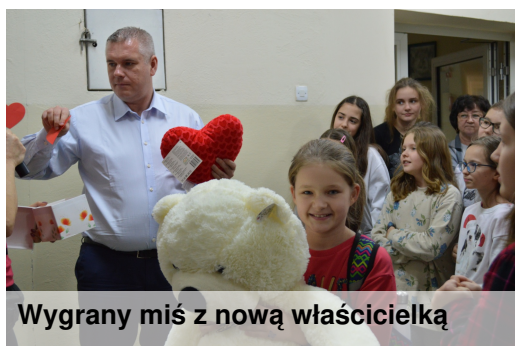
Wygrany miś z nową właścicielką

Nasi laureaci po ogłoszeniu wyników! Czekamy na dalsze wyzwania Junior Media.