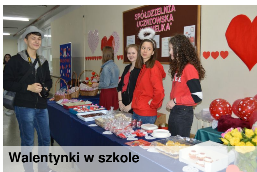
Walentynki w szkole