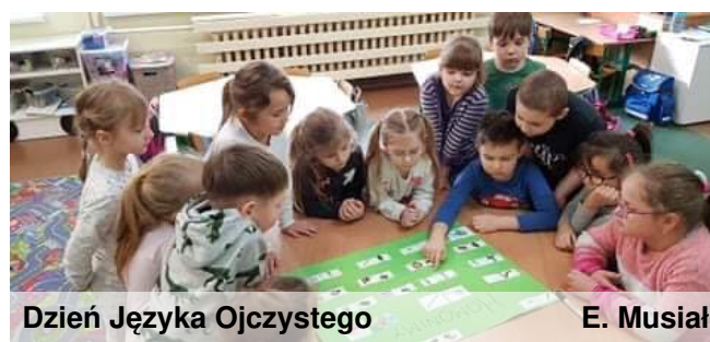
Dzień Języka Ojczystego