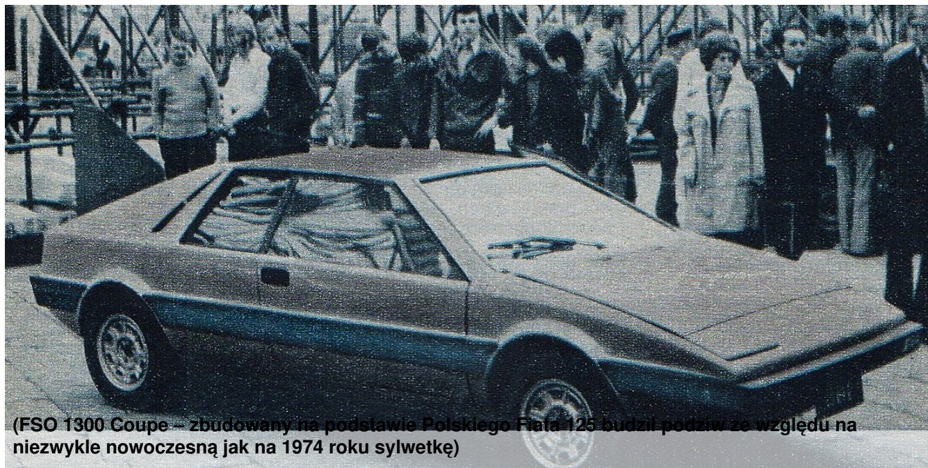
(FSO 1300 Coupe – zbudowany na podstawie Polskiego Fiata 125 budził podziw ze względu na niezwykle nowoczesną jak na 1974 roku sylwetkę)

motoryzacji mogłyby potoczyć się inaczej i do dziś moglibyśmy kupić samochód polskiej marki