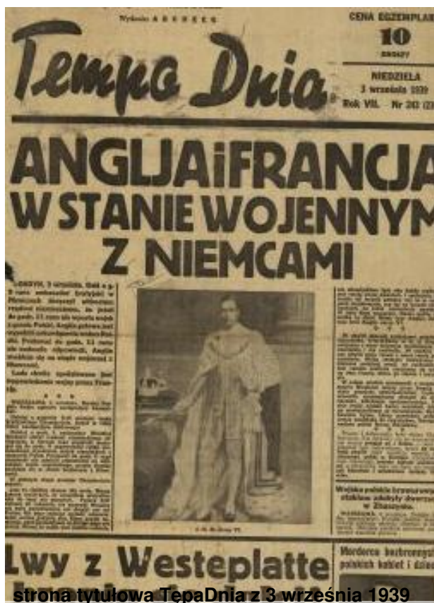
strona tytułowa Temple Dnia z 3 września 1939