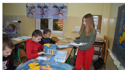
Zajęcia dotyczące krajów Unii Europejskiej.