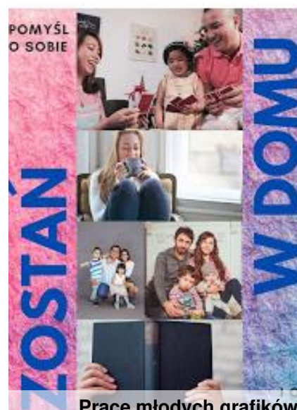
Prace młodych grafików