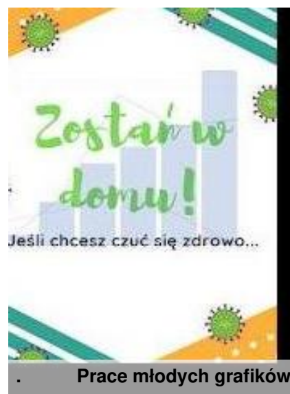
Prace młodych grafików