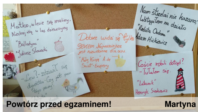
Powtórz przed egzaminem!