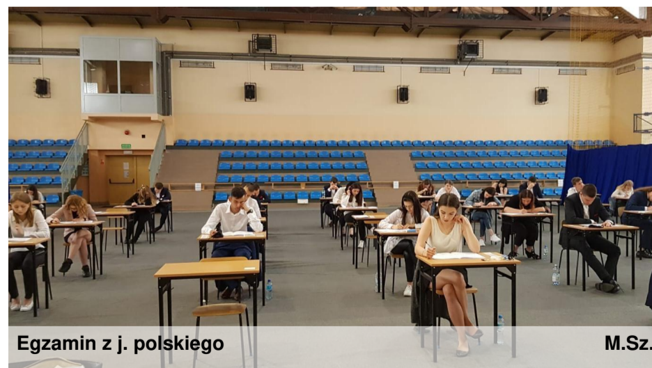
Egzamin z j. polskiego