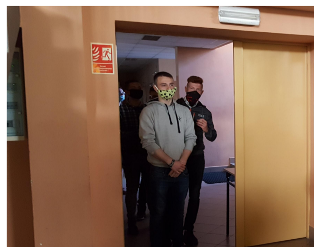
Egzamin 23 czerwca