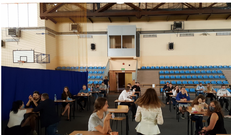
Egzamin 23 czerwca