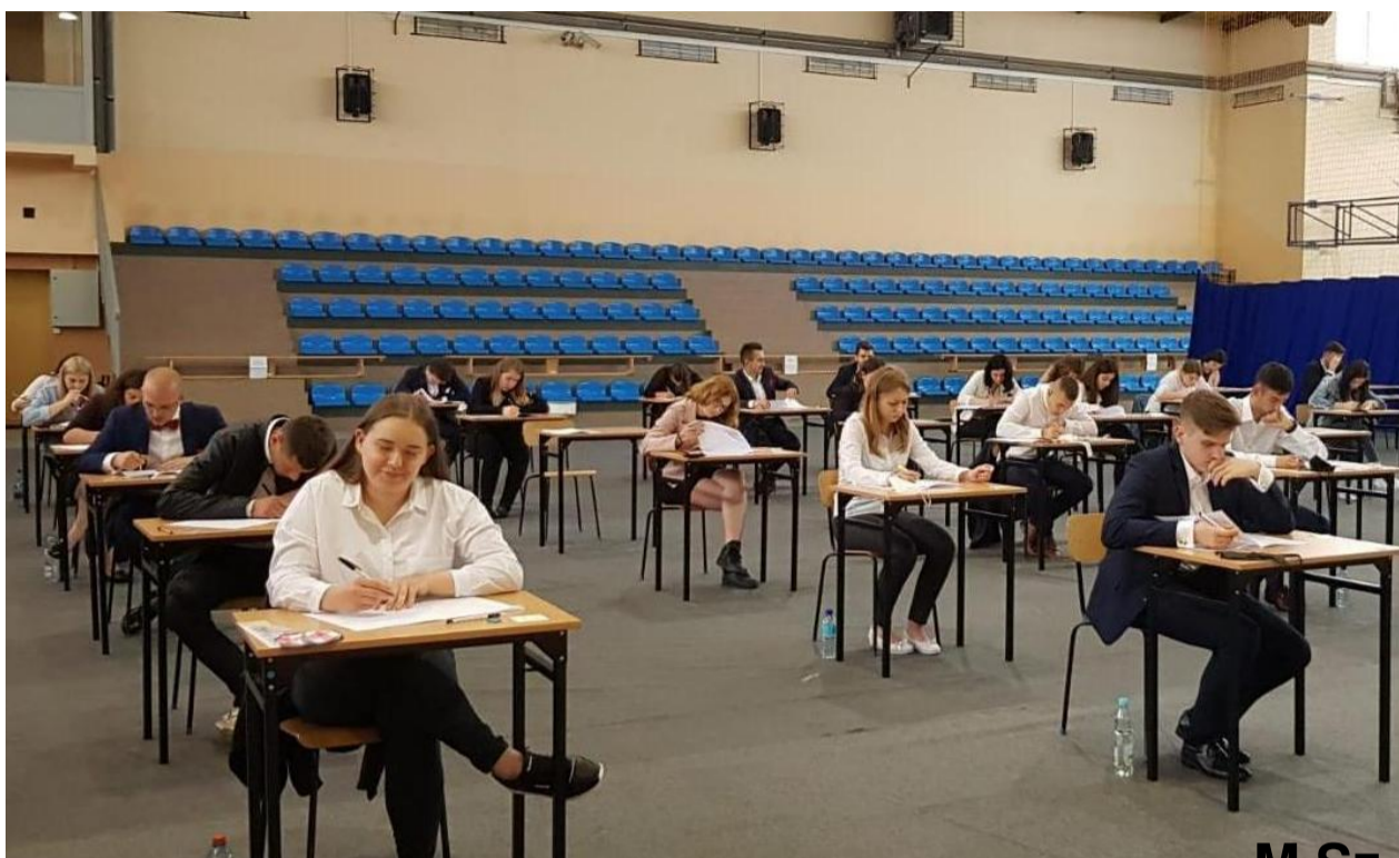
Egzamin z j. polskiego