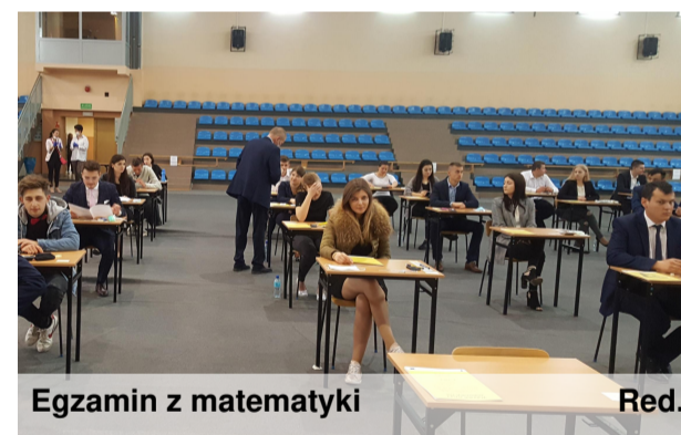
Egzamin z matematyki

Noszę od dzieciństwa cały ten bagaż: Skrzypce ojca w czarnym futerale, Drewniany talerz z napisem: „Do soli i chleba gości nam potrzeba”, Jedną dróżkę głęboką, Po której przesuwa się cień konia i wozu, Ścianę pleśni, Rozkładane łóżeczko, Wazon z gołąbkami, Przedmioty Trwalsze nad życie, Wypchanego głuszca Na spróchniałym kredensie, Ach - i jeszcze tę całą Piramidę schodów i drzwi. To nielekkie Dźwigać tyle rupieci. A wiem, że do końca Nie pozbędę się ani jednego. Aż przyjdzie mądra moja matka Przyjdzie znikąd donikąd, I powie: - Złóż to wszystko, córucho. To nie ma sensu.