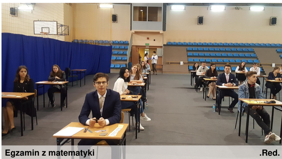
Egzamin z matematyki