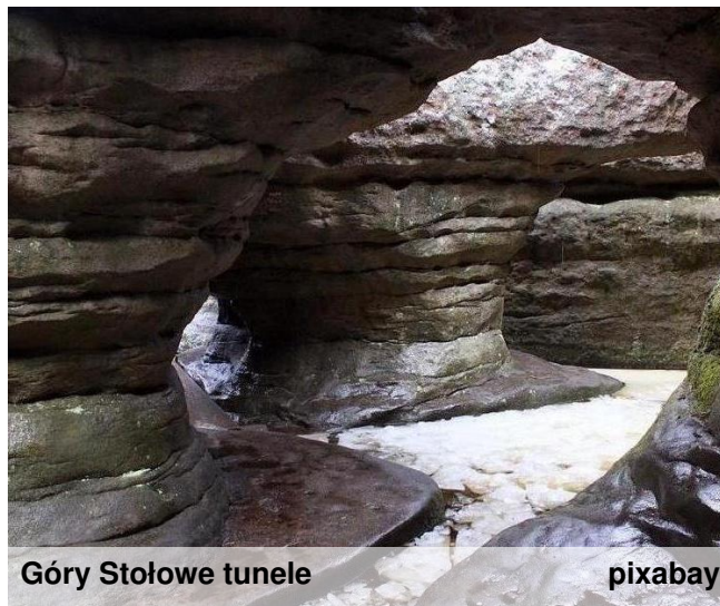
Góry Stołowe tunele

Więcej na ten temat znajdziecie w kolekcji "Nasza Polska" w bibliotece