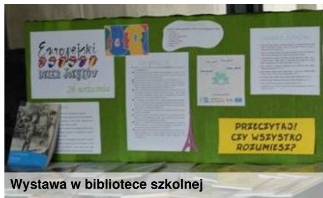
Wystawa w bibliotece szkolnej