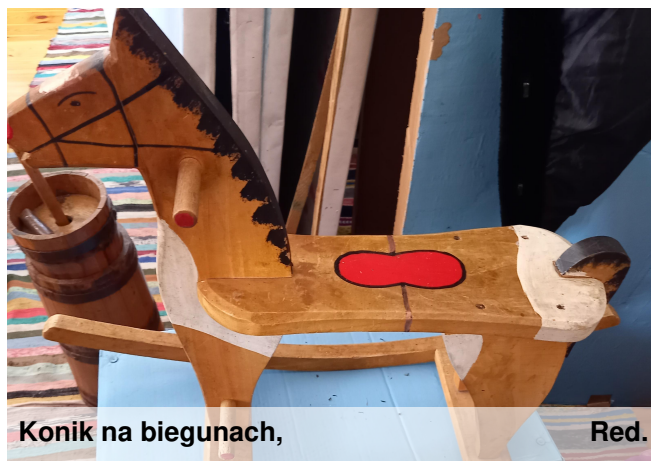
Konik na biegunach,