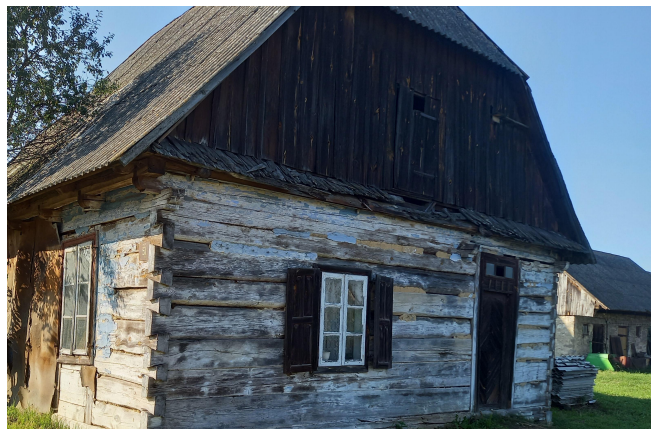
Zespół zagrodny Michalczaków. Red.