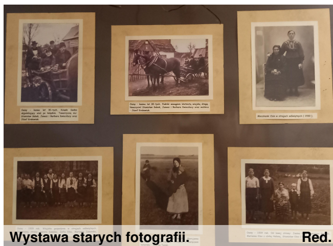
Wystawa starych fotografii.