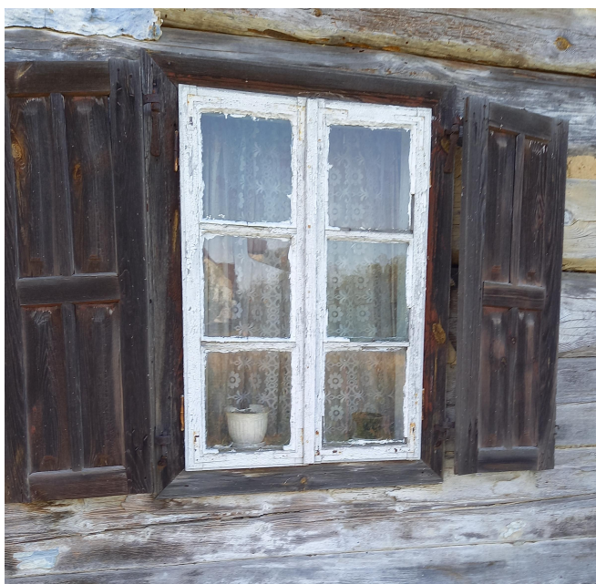
Okno na dawny świat. Red.