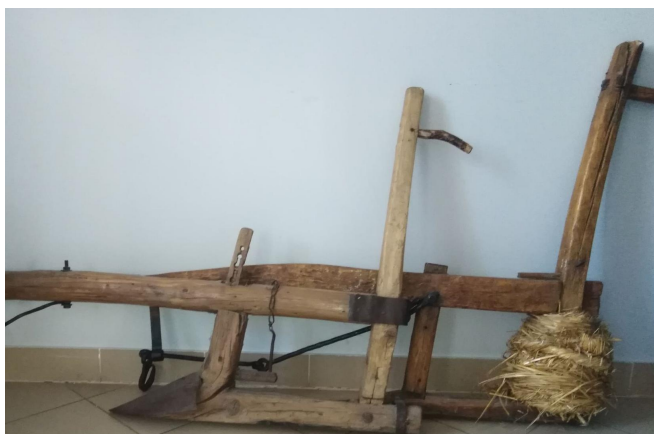
Stare rolnicze narzędzia - RADŁA.