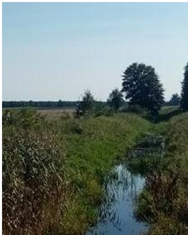
Nad naszą rzeczką...