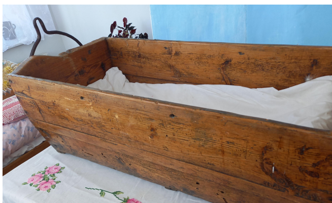
Kolyska podwieszana pod powałą.