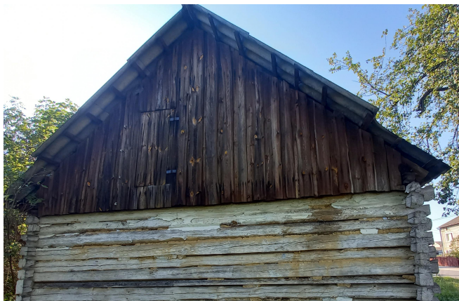
Chałupa z połowy XIX wieku. Red.