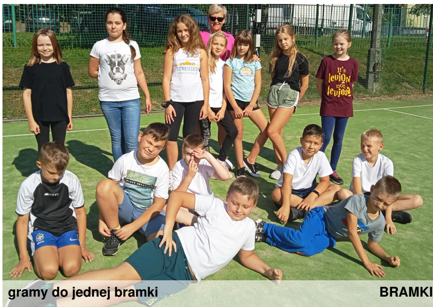
gramy do jednej bramki