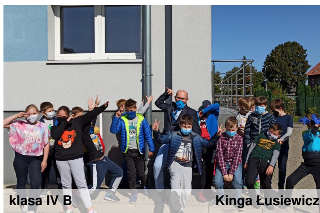
klasa IV B

Akcja „Sprzątnięcie świata” wiązała się również z wizytami w Punkcie Selektywnego Zbierania Odpadów Komunalnych oraz w Stacji Uzdatniania Wody. Mogliśmy tam dowiedzieć się więcej o działalności tych przedsiębiorstw oraz powtórzyć najważniejsze kwestie związane z segregacją odpadów.