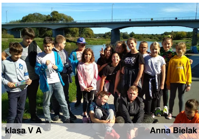
klasa V A