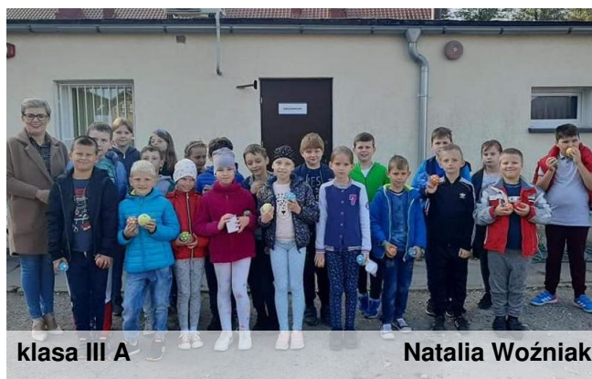
klasa III A