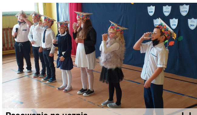
Pasowanie na ucznia