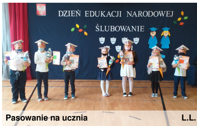
Pasowanie na ucznia