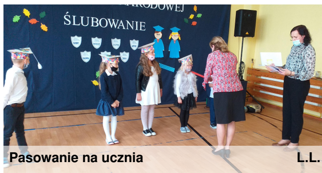
Pasowanie na ucznia