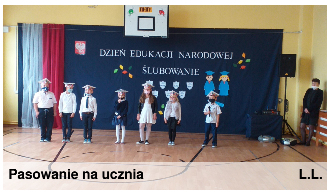
Pasowanie na ucznia