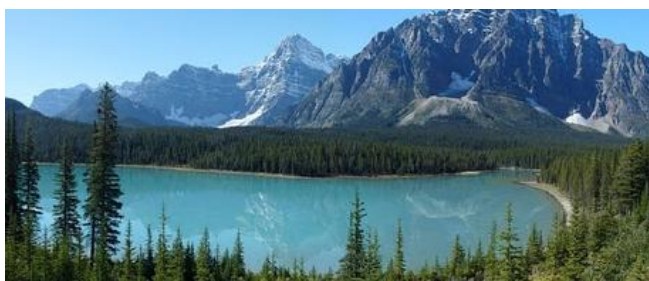
Jeziora w Kanadzie