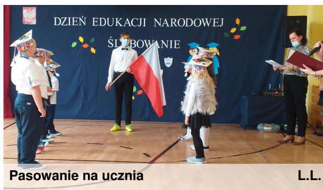
Pasowanie na ucznia