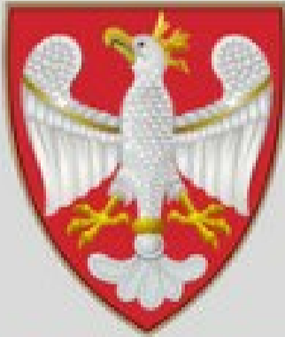
Herb Piastów (966-1370)