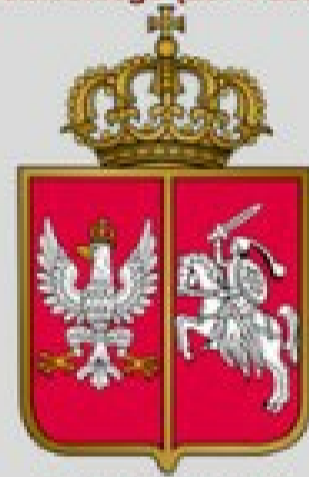
Herb z powstania listopadowego (1831-1832)