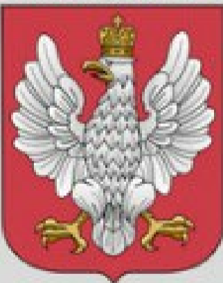
Herb Polski z lat 1919-1927