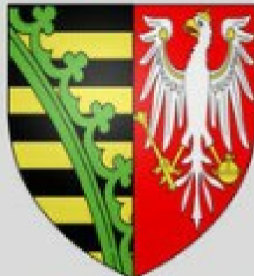
Herb za Księstwa Warszawskiego (1807-1815)