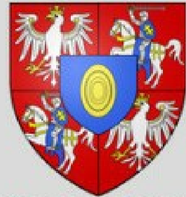
Herb za panowania Jana III Sobieskiego (1674-1696)