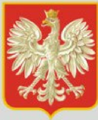
Herb Rzeczypospolitej Polskiej z 1927 r.