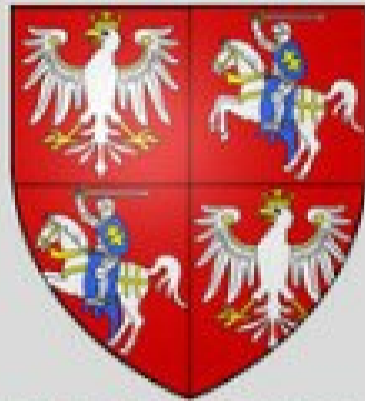
Herb polsko-litewskiego państwa Jagiellonów (1386-1569)