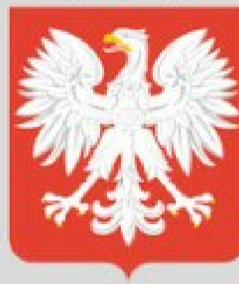
Godło PRL od 1952 do 1990