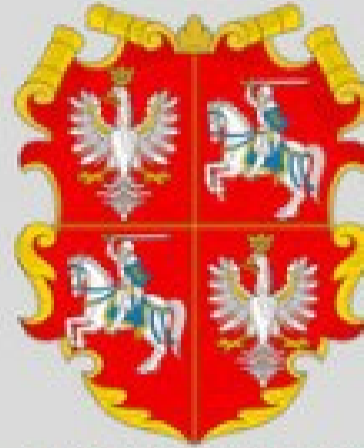
Herb Rzeczypospolitej Obojga Narodów po 1569 r.