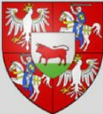
Herb Rzeczypospolitej za Stanisława Augusta Poniatowskiego (1764-1795)