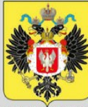
Herb Królestwa Polskiego (1815-1832)