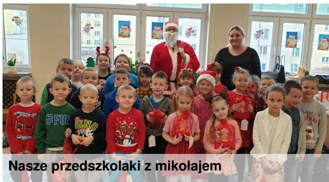
Nasze przedszkolaki z mikołajem