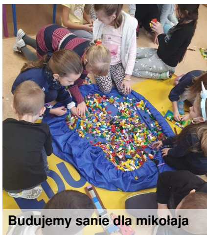
Budujemy sanie dla mikołaja