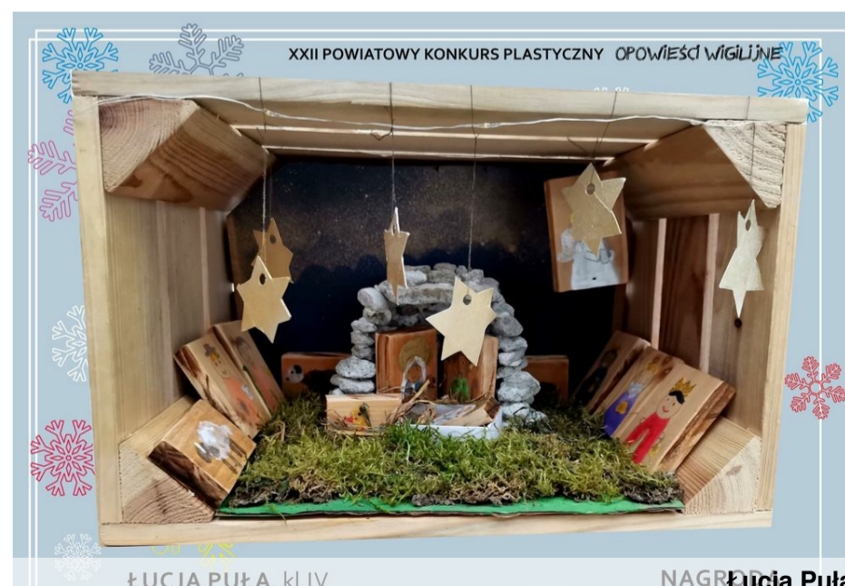
ŁUCJA PUŁA, kl.IV

Serdecznie gratulujemy wszystkim nagrodzonym. Dziękujemy także pozostałym uczestnikom konkursu, którzy przygotowali prace literackie i plastyczne. Wszystkie były naprawdę piękne! Warto wspomnieć, że w związku z obostrzeniami przepisów związanych z pandemią Covid 19 uroczysty finał konkursu i wręczenie nagród odbędzie się w późniejszym terminie. O dokładnej dacie PMDK poinformuje wszystkich zainteresowanych.