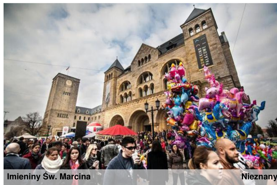
Imieniny Św. Marcina