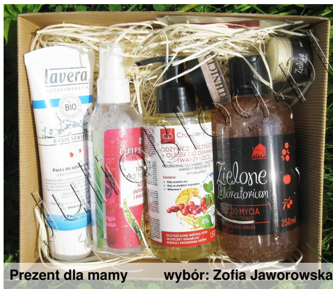
Prezent dla mamy