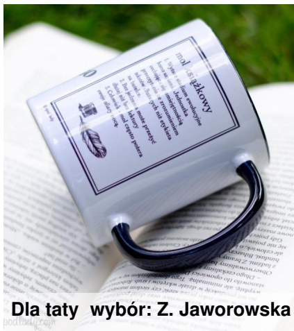
Dla taty wybór: Z. Jaworowska

Układasz wszystkie prezenty na sobie lub obok siebie, ładnie związujesz kokardą i gotowe!