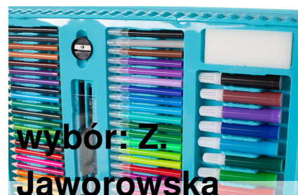
wybór: Z. Jaworowska