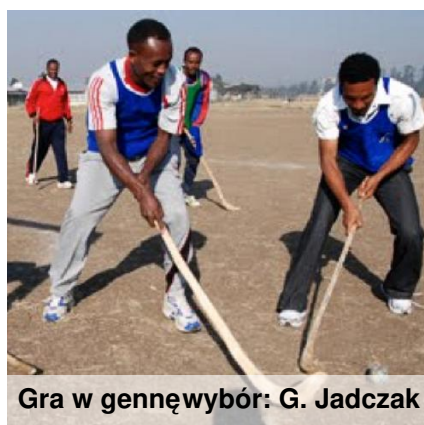
Gra w gennęwybór: G. Jadczyk

- dniowy post. Inną tradycją jest genna, czyli gra podobna do hokeja na trawie. Legenda głosi, że pasterze w Betlejem spędzali czas, grając w gennę.