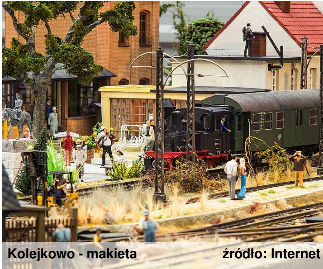
Kolejkowo - makieta

Dzisiejszą podróż po ciekawych miejscach w Polsce odbędziemy do stolicy Dolnego Śląska - Wrocławia. Jest to zabytkowe miasto położone nad Odrą. Chciałbym przedstawić Wam dwa niezwykle ciekawe miejsca, które z pewnością zainteresują dzieci i młodzież.