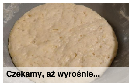
Czekamy, aż wyrosnie...