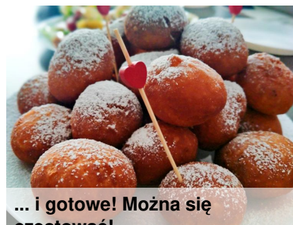
... i gotowe! Można się częstować!