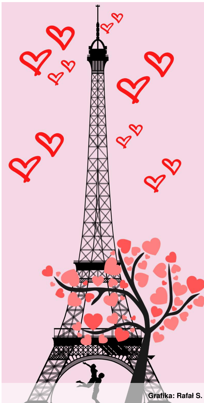
Grafika: Rafał S.

Witajcie! Przed Wami specjalne walentynkowe wydanie "SZKOLNIAKA". Dowiedziecie się, skąd się wzięły walentynki, poznacie ciekawostki i fakty na ich temat. A Rafał przeniesie Was w filmowy świat miłości. Życzymy miłego czytania.