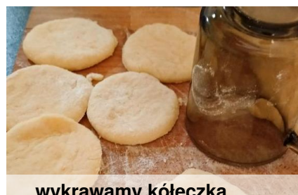
... wykrawamy kółeczka...