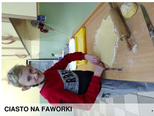
CIASTO NA FAWORKI