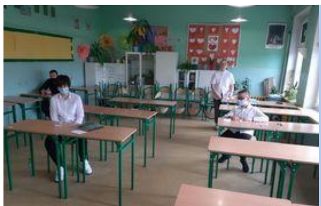
egzamin z matematyki

W czwartek 19 marca uczniowie zmierzyli się z zadaniami matematycznymi. Dla wielu był to jeden z najtrudniejszych egzaminów, ale pozytywne nastawienie towarzyszyło Młodzieży przez cały czas. Było wiele zadań z geometrii, gdzie należało obliczyć pole figur oraz znać podstawowe reguły geometryczne. Zadania z algebry dotyczyły ułamków i liczb całkowitych. W zadaniach otwartych ósmoklasiści zmierzyli się również z geometrią oraz umiejętności rozwiązywania zadań z jedną i dwiema niewiadomymi.