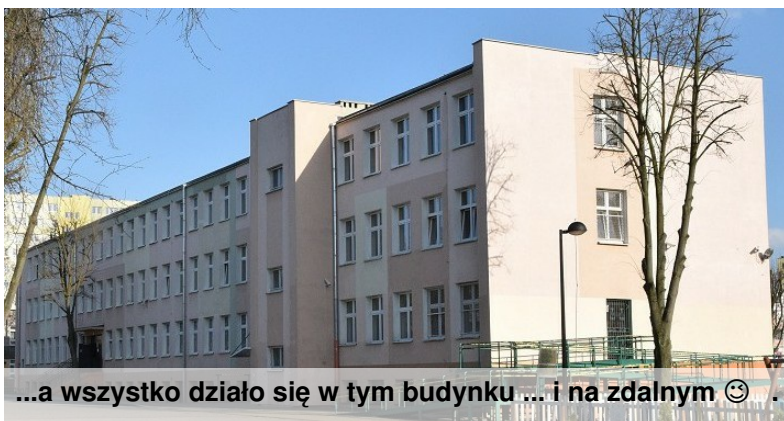
...a wszystko działa się w tym budynku ... i na zdalnym 😊