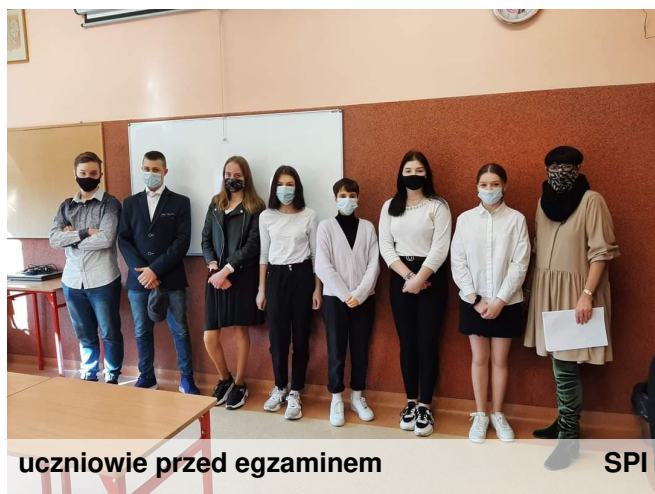
uczniowie przed egzaminem

A wszystko po to aby uczniom zapewnić jak największy komfort i bezpieczeństwo.