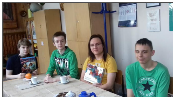
Spotkanie w „Oporniku” 12 stycznia 2018r.

F.M.: Z nazwy kojarzę na pewno, aczkolwiek nie wiem, czy cokolwiek z niego widziałem, czy korzystałem.