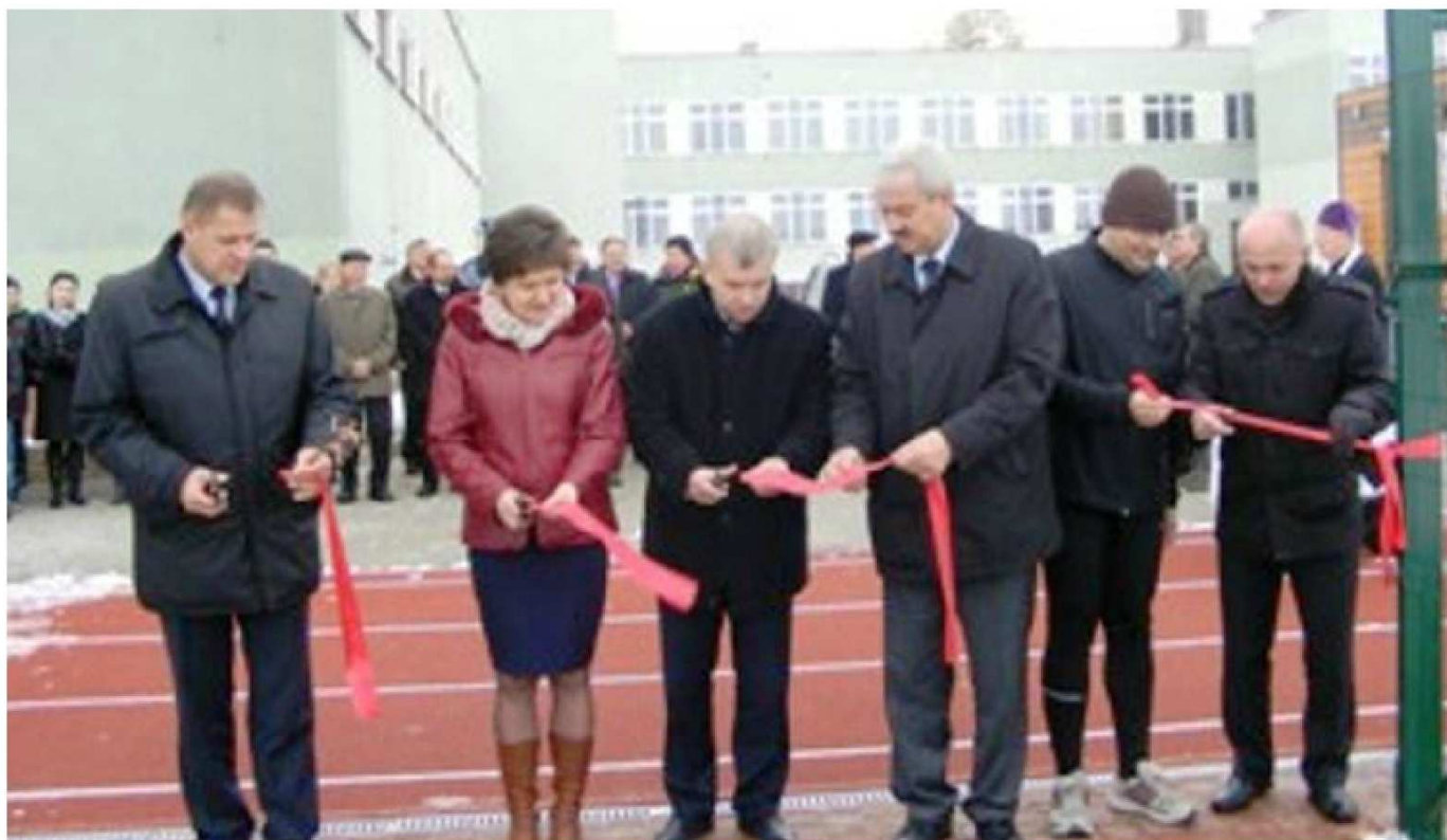
fot. uroczyste przecięcie wstęgi