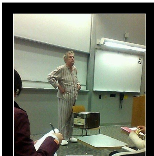
Kiedy zapomniałeś, że już nie uczysz zdalnie

W szkole nadal mają być stosowane wytyczne sanitarne, zgodnie z którymi najważniejsze zasady bezpieczeństwa to: dystans, dezynfekcja, higiena, noszenie maseczki w przestrzeniach wspólnych i wietrzenie pomieszczeń. Uczniowie wszystkich klas branżowych szkół I stopnia, będący młodocianymi pracownikami, będą realizowali zajęcia praktyczne u pracodawców w pełnym wymiarze godzin.