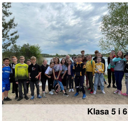
Klasa 5 i 6

Lekcje zadane były dla mnie ciężkie bo nie można było się skoncentrować i trudno było zrozumieć niektóre tematy. Momentami były przyjemne, gdyż mogłam robić to czego nie mogłam w szkole.