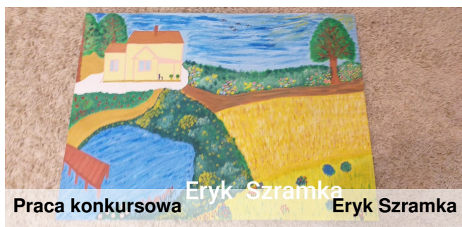
Praca konkursowa Eryk Szramka Eryk Szramka