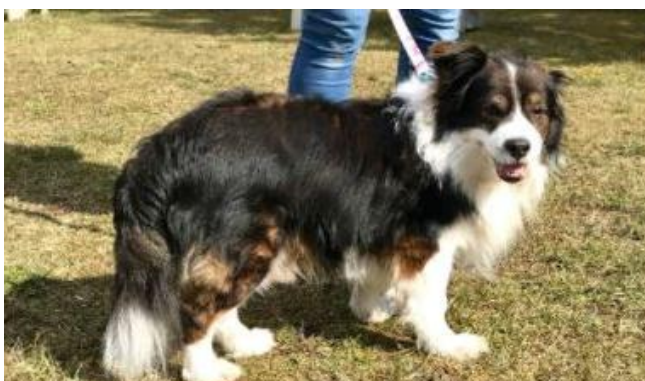
Może mnie przygarniesz?