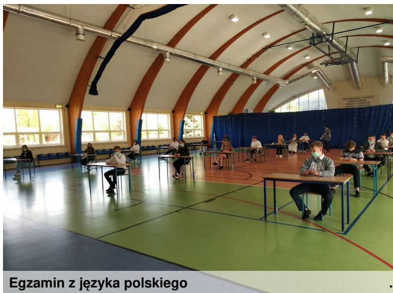
Egzamin z języka polskiego

Sędziogo nauki o grzeczności. Jeśli chodzi o dłuższą pracę pisemną, to mogli napisać opowiadanie o wspólnej przygodzie z bohaterem literackim lub rozprawkę, w której należało udowodnić twierdzenie, że "w trudnej sytuacji człowiek poznaje samego siebie". Następnego dnia