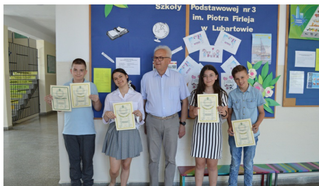
Laureaci konkursów literacko-językowych z panem dyrektorem