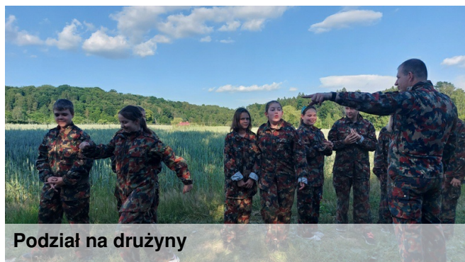
Podział na drużyny

Nie musicie niczego kupować, wszystko wypożyczamy: marker paintballowy (inaczej broń paintbalowa, która dostosowana jest również do wieku graczy), maskę na twarz, zbiornik na naboje z barwnikiem i zbiornik z CO2 lub skompresowanym powietrzem, który zasila broń. Mamy również możliwość wypożyczenia stroju, tj. bluzy i spodni moro, kamizelki kuloodpornej oraz rękawic. My otrzymaliśmy również lekki hełm, który zabezpieczał nasze głowy przed pociskiem. Uderzenie kulką czasem trochę boli, a odpowiedni strój to niweluje. Jedyne, co musisz ze sobą zabrać, to dobre buty i woda, by ugasić pragnienie.