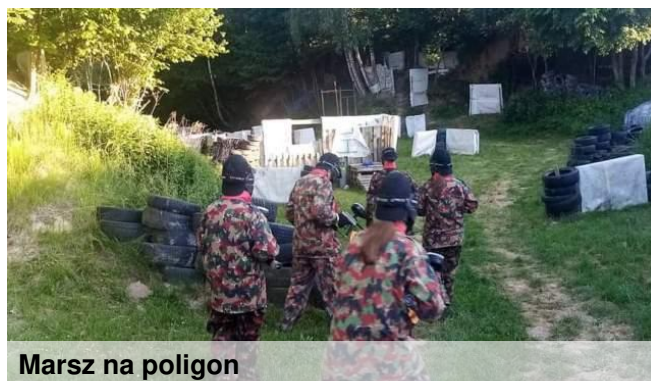
Marsz na poligon