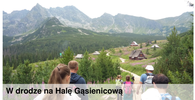
W drodze na Halę Gąsienicową

Co jeszcze warto zobaczyć w Tatrach? Piękne widoki zagwarantuje nam wejście na Kasprowy Wierch przez Dolinę Jaworzynki lub kierując się przez Boczań. Idąc tym szlakiem, po drodze miniemy piękne schronisko „Murowaniec”, gdzie możemy usiąść na dłuższy odpoczynek. Potem już bardziej wyczerpująca wspinaczka na Kasprowy Wierch. Dla tych bardziej leniwych istnieje możliwość wjazdu na szczyt kolejką górską. Ci, którzy nie lubią wspinaczki, mogą udać się nad Morskie Oko, do Doliny Chochołowskiej lub Doliny Kościeliskiej. Wrażenia równie silne.