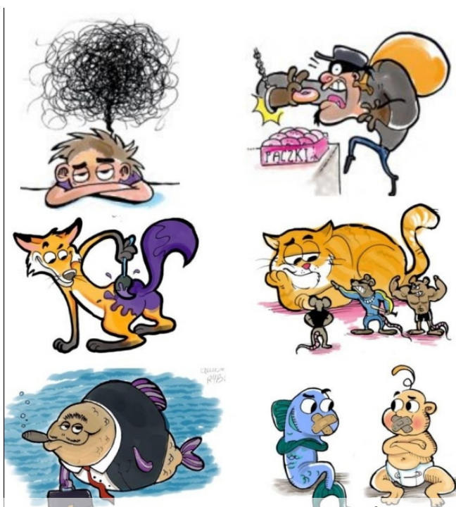
Takie związki frazeologiczne przerabialiśmy na opowiadanie