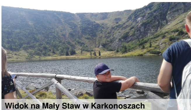
Widok na Mały Staw w Karkonoszach