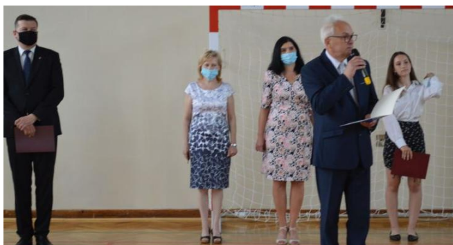
Uroczystość pożegnania absolwentów czas zacząć...