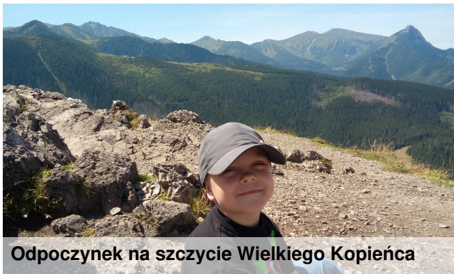
Odpoczynek na szczycie Wielkiego Kopiańca

Swoją pierwszą podróż w Tatry odbyłem wraz z rodzicami jako czteroletni chłopiec. Mimo że minęło od tego momentu już kilka lat, pamiętam swoje pierwsze wejście na szczyt. Była to Sarnia Skala, z której rozciągał się piękny widok na słynny Giewont. Wejście na górę nie było zbyt trudne, więc dzięki temu zapalałem miłością do górskich wędrówek. Prosty do zdobycia szczyt, jak na pierwsze wędrówki, jest Nosal. Myślę, że dla wielu z Was wspinaczka ta nie sprawiłaby trudności.