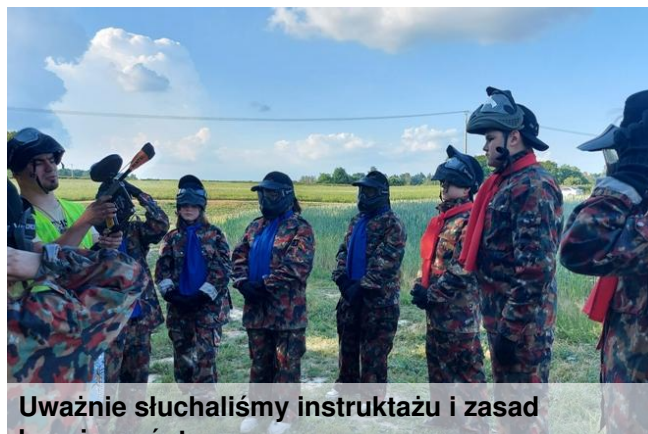
Uważnie słuchaliśmy instruktora i zasad bezpieczeństwa