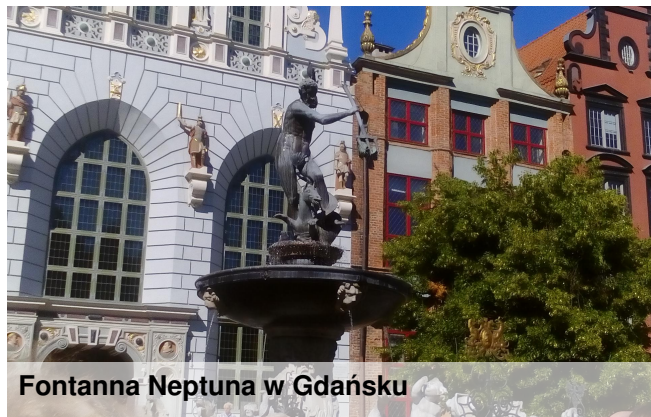
Fontanna Neptuna w Gdańsku

Usytuowanie Helu na cyplu Półwyspu Helskiego jest wyjątkowe. Wody Bałtyku otaczają go z trzech stron, co daje niesamowite wrażenie. W pobliżu Helu uformował się zespół malowniczych wydm białych i szarych, które objęte są ochroną w granicach Nadmorskiego Parku Krajobrazowego. Cała Mierzeja Helska jest ciekawa pod względem przyrodniczym oraz krajobrazowym. W przeszłości Hel miał duże znaczenie strategiczne, stanowił bazę morską floty wojennej, która posiadała rozbudowany system stanowisk obrony artyleryjskiej. Zachowały się fragmenty Rejonu Umocnionego Hel, a na nadbrzeżu stoi najstarszy polski okręt "Batory". Niedaleko dworca PKP "Hel" rozpoczyna się najdłuższy na Półwyspie Helskim Szlak Militaryny. Spotkać na nim można głównie militaria z okresu II Rzeczypospolitej. Są tu betonowe schrony oraz usytuowane tuż nad brzegiem morza cztery stanowiska ogniowych dział. Na Helu warto odwiedzić również Latarnię Morską Hel, Fokarium oraz Muzeum Rybołówstwa.