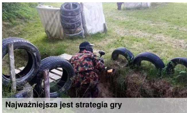
Najważniejsza jest strategia gry