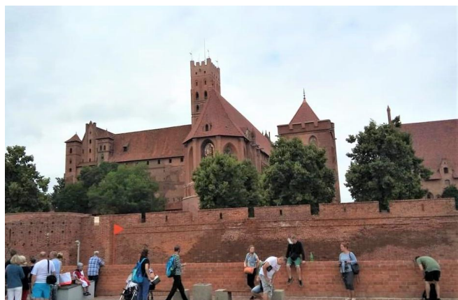
Zamek w Malborku