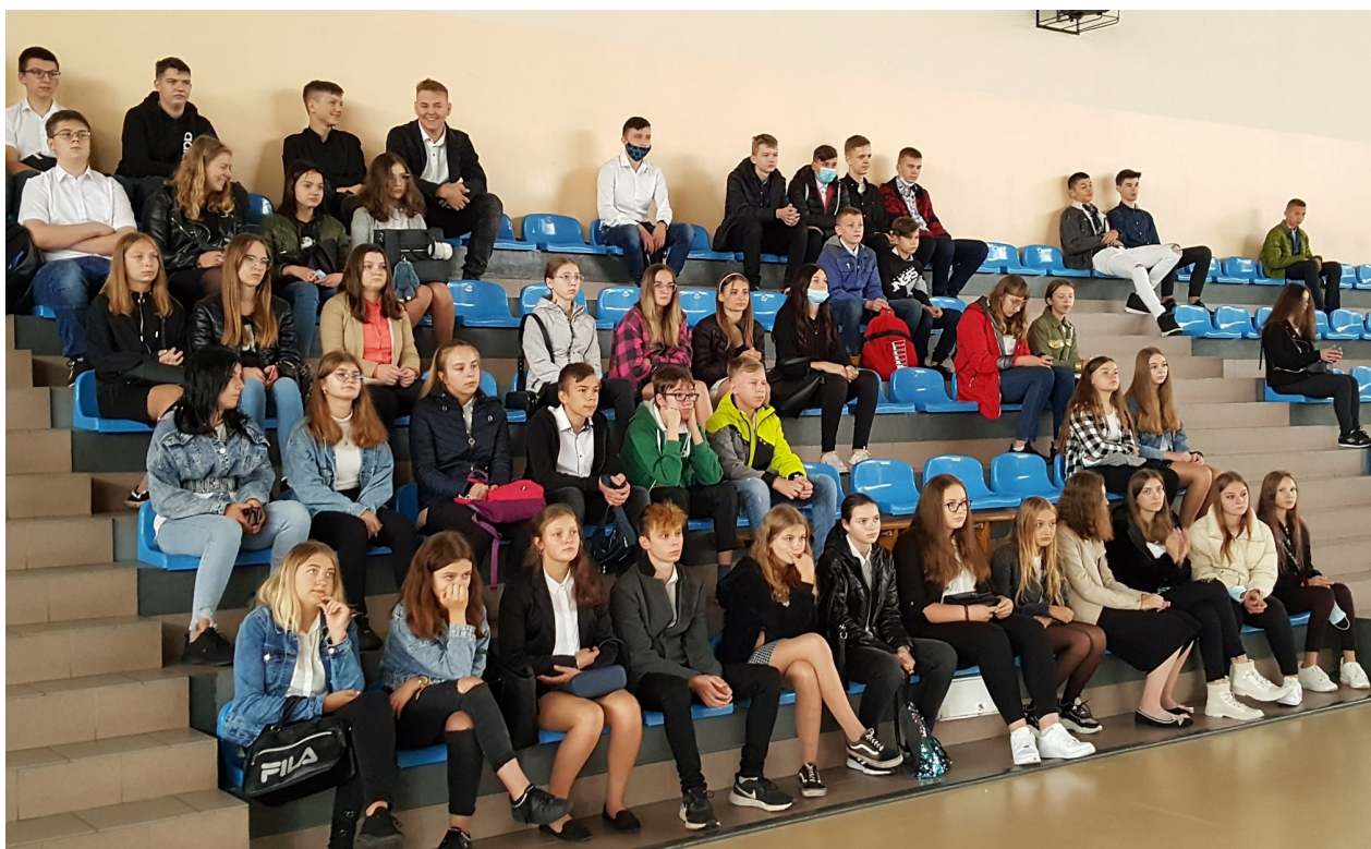
Rozpoczęcie roku szk.