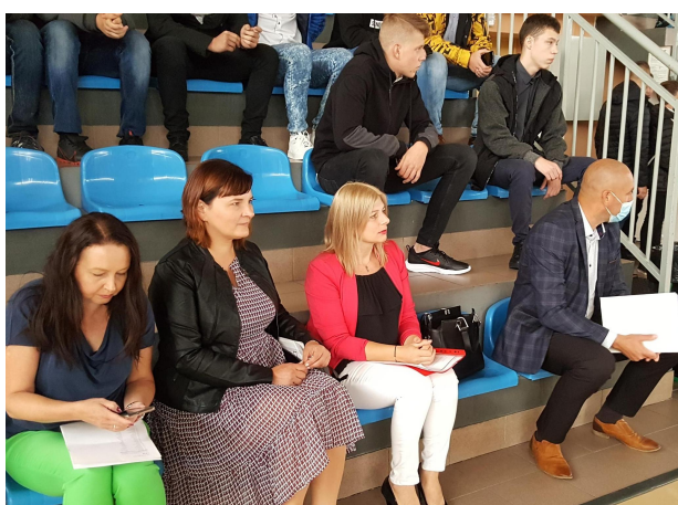
.Rozpoczęcie roku szk.

Po części oficjalnej uczniowie mogli bliżej poznać swoich opiekunów już na spotkaniu w klasie. Tego dnia było jeszcze w programie zwiedzanie szkoły - wiadomo, że na początku można nieco się pogubić w labiryncie korytarzy. Tu z pomocą przyjdzie "koniec języka za przewodnika" w pierwszych dniach nauki.