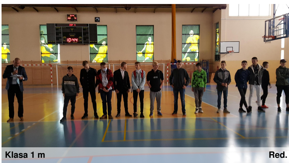
Klasa 1 m