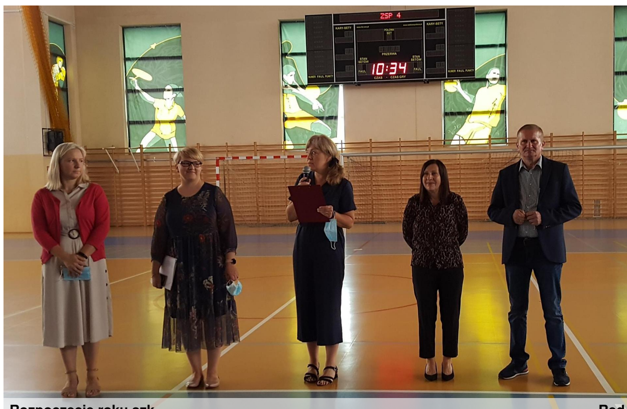
Rozpoczęcie roku szk

Wrzesień jeszcze się nie skończył, ale to nie znaczy, że nie można powoli zacząć planować ferii zimowych. Sprawdźcie w kalendarzu, kiedy wypadają dni wolne od nauki w roku szkolnym 2021/2022. Znajdziecie go w zakładce „Dla rodziców” na stronie internetowej szkoły: www.zsp4.piotrkow.pl