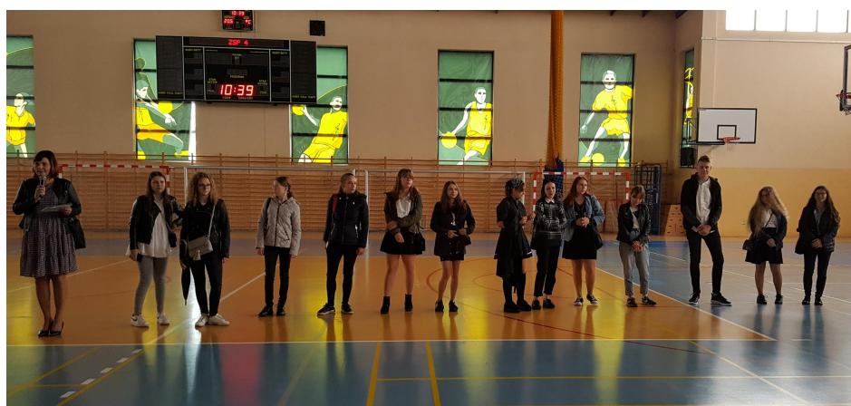
.Klasa 1 tg