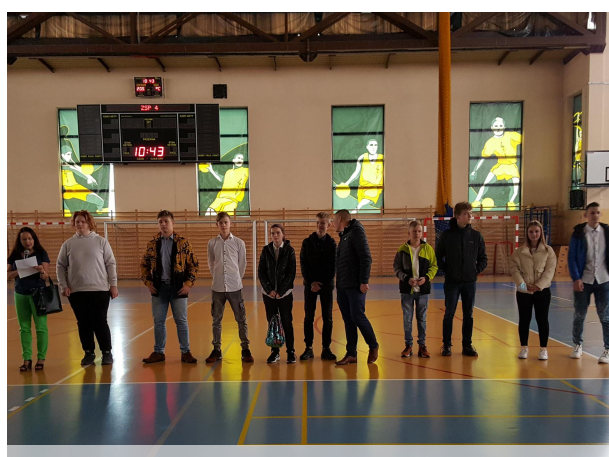
Klasa 1 fm