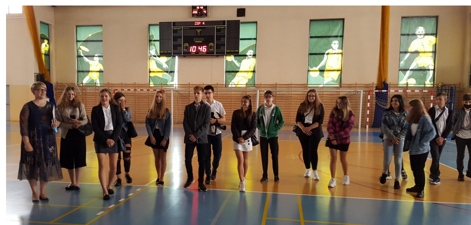
Klasa 1 tfs