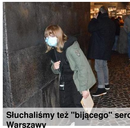
Słuchaliśmy też "bijącego" serca Warszawy