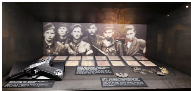
Niemie świadkowie historii