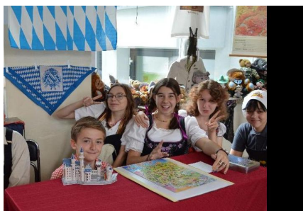
W oczekiwaniu na zwiedzających... Stroje mamy super, oby nam tylko wszystko wyszło!