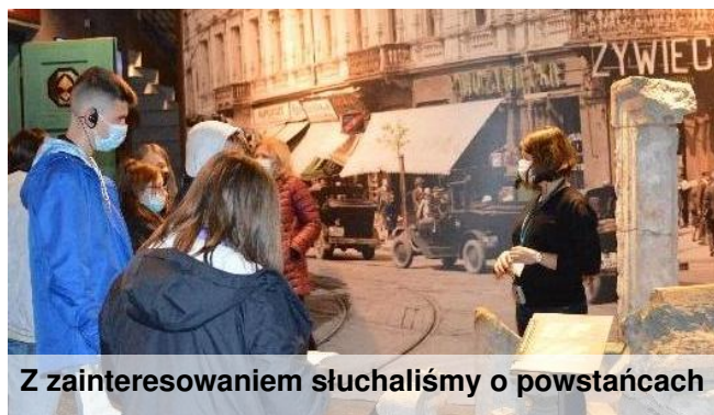
Z zainteresowaniem słuchaliśmy o powstańcach