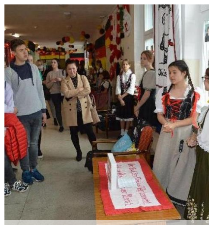
Po zmaganiach konkursowych nasi goście także z wielką przyjemnością "udali" się w podróż po Niemczech