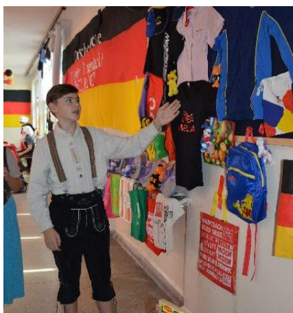
A to strój sportowca zza Odry