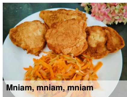
Mniam, mniam, mniam