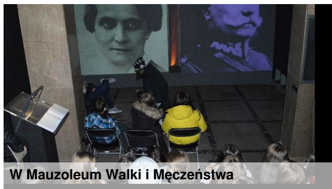
W Mauzoleum Walki i Męczeństwa

W podobnej wycieczce do Warszawy uczestniczyli tego dnia także uczniowie z klas: 8a i 8g.