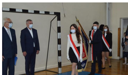
Uroczyste rozpoczęcie roku szkolnego 2010/2021