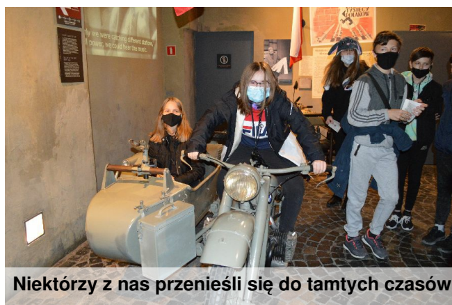
Niektórzy z nas przenieśli się do tamtych czasów