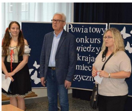
Konkurs powiatowy czas zacząć... Obok cała nasza grupa w oryginalnych strojach