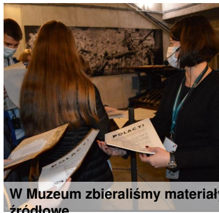
W Muzeum zbieraliśmy materiały źródłowe