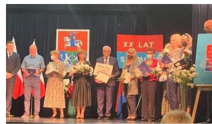
Nagrodzeni opiekunowie samorządów lubartowskich szkół