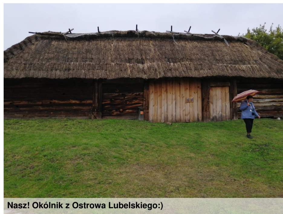
Nasz! Okólnik z Ostrowa Lubelskiego:)

A to wszystko wyśpiewane na rockową nutę, wsparte pokazem obrazów. Widownia była bardzo aktywna, wiele osób zdobyło pamiątkowe upominki ufundowane przez IPN.