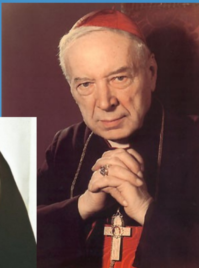
Kardynał Stefan Wyszyński