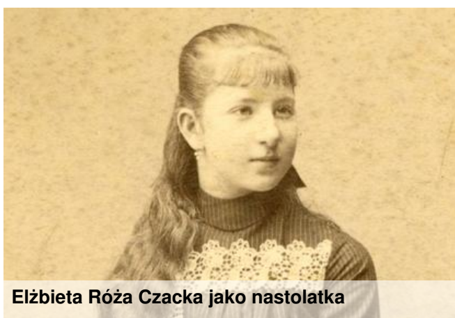
Elżbieta Róża Czacka jako nastolatka