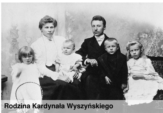
Rodzina Kardynała Wyszyńskiego