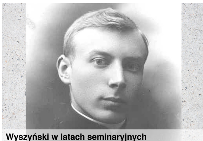
Wyszyński w latach seminaryjnych

Po zakończeniu działań wojennych wrócił do Włocławka. W 1946 roku mianowany został przez Ojca Świętego Piusa XII biskupem ordynariuszem Diecezji Lubelskiej. Sakrę biskupią przyjął 12 maja na Jasnej Górze z rąk prymasa Augusta Hłonda, po którym dwa lata później przejął obowiązki Prymasa Polski. Zostaje też wtedy arcybiskupem Gniezna i Warszawy.