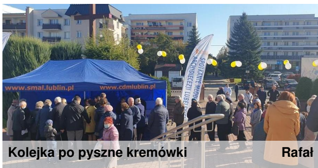
Kolejka po pyszne kremówki