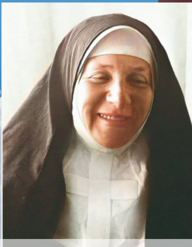
Matka Elżbieta Róża Czacka