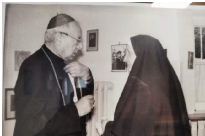
Nasi błogosławieni - S. Wyszyński i E. Czacka