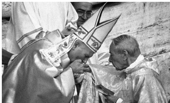
Jan Paweł II z szacunkiem całuje pierścień Kardynała Wyszyńskiego

16 października 1978 r. wziął udział w konklawe, które wybrało na Stolicę Piotrową ks. kard. Karola Wojtyłę, a następnie uczestniczył w uroczystościach inauguracji pontyfikatu (22 X).