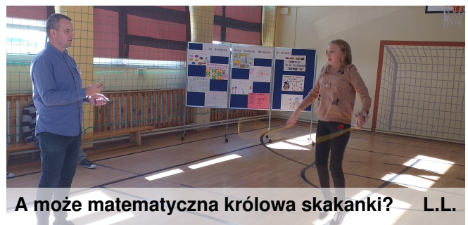
A może matematyczna królowa skakanki?