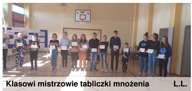
Klasowi mistrzowie tabliczki mnożenia