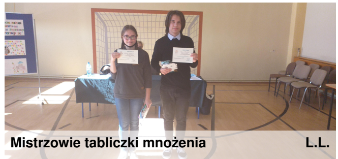
Mistrzowie tabliczki mnożenia