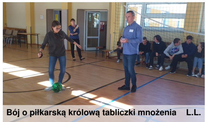
Bój o piłkarską królową tabliczki mnożenia