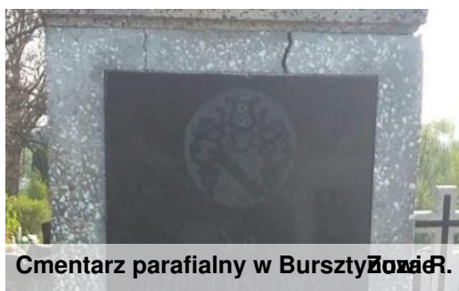
Cmentarz parafialny w Bursztynowie Zuza R.