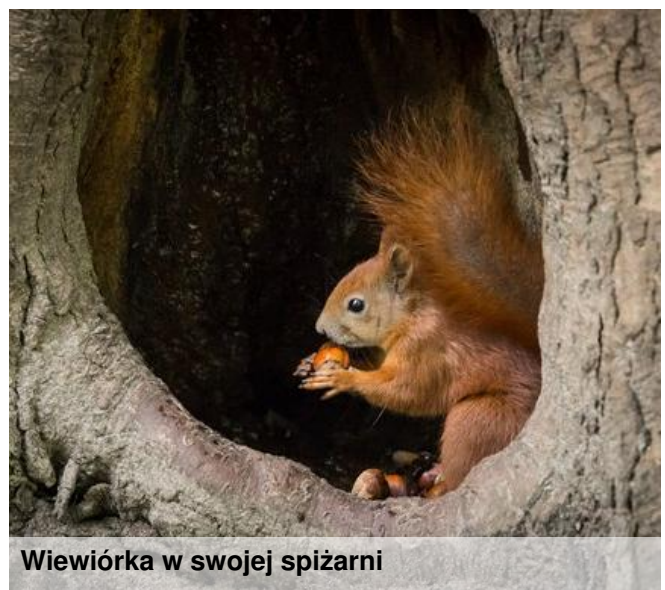
Wiewiórka w swojej spiżarni