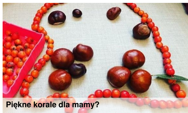
Piękne korale dla mamy?