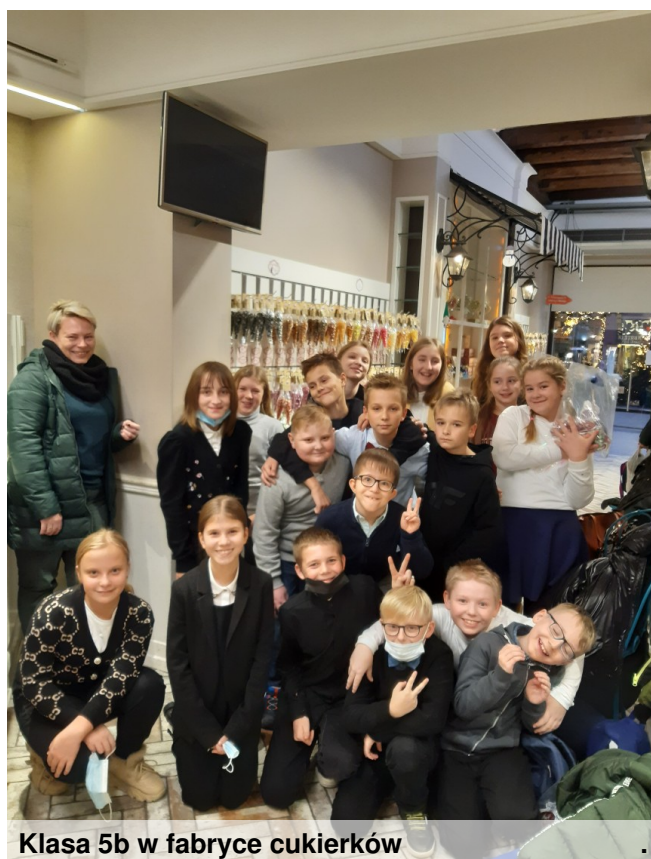
Klasa 5b w fabryce cukierków