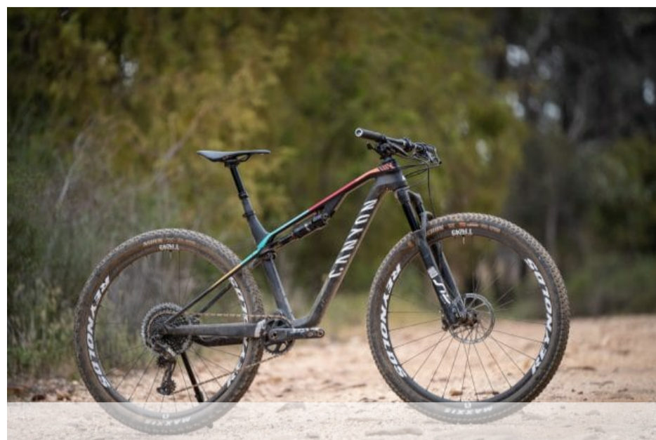
Canyon lux 2020