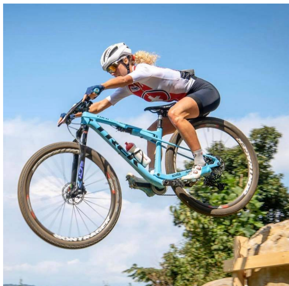
Jolanda Neff podczas mistrzostw olimpijskich w Tokio